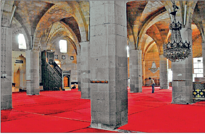
Aksaray Ulucamii'nin harim kısmından bir görünüşü

taçkapı dikdörtgen formlu ve cepheden taşkın biçimde ele alınmıştır. Mukarnaslı kavsaraya sahip, sivri kemerli girişin iki yanında birer niş görülmektedir. Cephenin iki yanında pilastırlarla iki katlı düzenleme oluşturulmuştur. Bu düzenlemelerden altta yer alanında mukarnaslı bir niş ve bunun üzerinde yatay yerleştirilmiş boş bir kartuş bulunmaktadır. Bu düzenlemenin üzerinde dilimli, kör bir kemer ve iki yanında birer rozet motifli mevcuttur. Üstte yer alan ikinci alanda ise şemse formunda bitkisel bezeme görülmektedir. Cephe düzenlemesi üstte profilli bir kornişle sınırlandırılmış olup taçkapının üstü içi bitkisel bezemeli üçgen alınlıkla sonlanmaktadır.