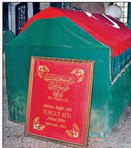
Turgut Reis'in türbesiyle sandukası