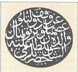
Pertevniyal Vâlide Sultan Kütüphanesi'nin vakıf mührü

La Caduta di Costantinopoli adlı büyük eseri 1976'da ilim âlemine sunulmuş, daha sonra tıpkıbasımları yapılmıştır. Neşirini göremediği ek cildi, öğrencisi A. Carile tarafından uzun bir giriş yazısıyla birlikte Testi inediti e poco noti sulla caduta di Costantinopoli adıyla neşredilmiştir (Bologna 1983). Bu külliyyatın I. cildi İstanbul'un fethine doğrudan şahit olup izlenimlerini kaleme alan kişilere ayrılmıştır. II. cildin alt başlığı "İstanbul'un Fethinin Dünyadaki Yankısı" biçimindedir. Fethi doğrudan şahit olmayanların eserlerinden hareket edilip bir asır sonra fethi kitabında geniş yer veren Hoca Sâdeddin'e kadar kişilerin konuyu ele alış şekillerini tahlil eder. III. ciltte ilk iki ciltte belgelerle