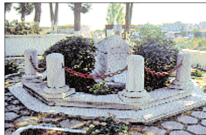
Nâmık Kemal'in mezarı