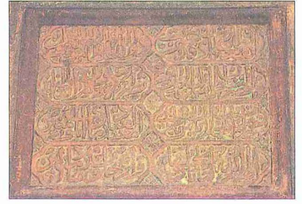
Ayas Paşa Camii inşa kitâbesi

ları zevkine işaret eder. Caminin orijinal güzelliğini koruyabilmiş tek aksama, değişik biçimli bir kemer içinde açılmış olan kapısıdır. Minare girişi de aynı üslûpta daha ufak biçimde yapılmıştır.