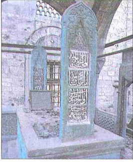
Ayas Paşa'nın Eyüp Sultan Camii hazîresindeki türbesinde bulunan kabri - Eyüp / İstanbul

3 yıl 4 ay kadar süren vezîriâzamlığı sırasında padişahla birlikte katıldığı Korfu (1537) ve Kara Boğdan (1538) seferlerinden başka, Hadim Süleyman Paşa'nın Hint Seferi (1538) ile Preveze Zaferi vuku buldu. Bunlardan Korfu Seferi sırasında kendisinin teşvikiyle Avlonya yöresindeki Arnavutlar itaat altına alındı ve bu bölgede Delvine sancağı kuruldu. Boğdan Seferi ise bu ülkedeki Osmanlı hâkimiyetinin kuvvetle yerleşmesine sebep oldu. Barbaros'un ve Süleyman Paşa'nın deniz harekâtı da Akdeniz ve Hint sularındaki Osmanlı nüfuzunu arttırdı.